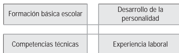
Diagrama 1: Elementos para un desarrollo integrado de competencias profesionales

Para la formación profesional inicial, las experiencias de integración en grupos de trabajo y comunicación en grupos heterogéneos (en cuanto a edades y -frecuentemente- culturas) tienen un valor particular. Mientras que en algunas regiones rurales existen a menudo recursos suficientes, entre jóvenes crecidos en ambiente urbano pueden existir déficit de integración y comunicación en grupos de trabajo heterogéneos. Como se ha explicado antes, la formación general es importante como marco de aplicabilidad de conocimientos técnicos, capacidades y competencias, no sólo para el segmento superior de la estructura de profesiones, sino también a escala general. El concepto de "cualificaciones básicas" comprende competencias de actuación esenciales para el mundo profesional y el del ocio que han creado las tecnologías de la información y la comunicación, y debe cumplir por tanto las condiciones mínimas que permiten a la persona su formación e inserción profesional.